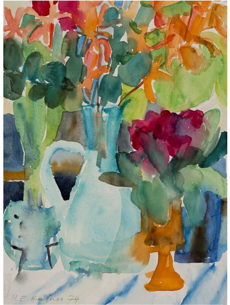
Maria Hafner, ohne Titel , Aquarell auf Papier, 1974

Finissage (mit Möglichkeit zum Mittagessen zu Fr. 35.-)