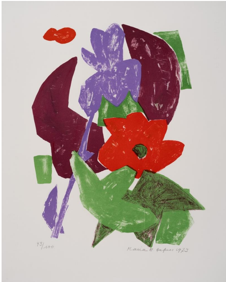
Maria Hafner, ohne Titel , Lithografie, 1973

Veranstaltungen zum 100. Geburtstag (1.04.1923 – 15.12.2018)