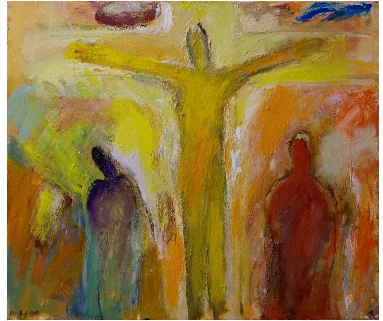
Maria Hafner, Maria und Johannes unter dem Kreuz , aus: «14 Stationen der Kraft», Acryl auf Leinwand, 1999

Karfreitagliturgie mit Bildern aus dem Bilderzyklus