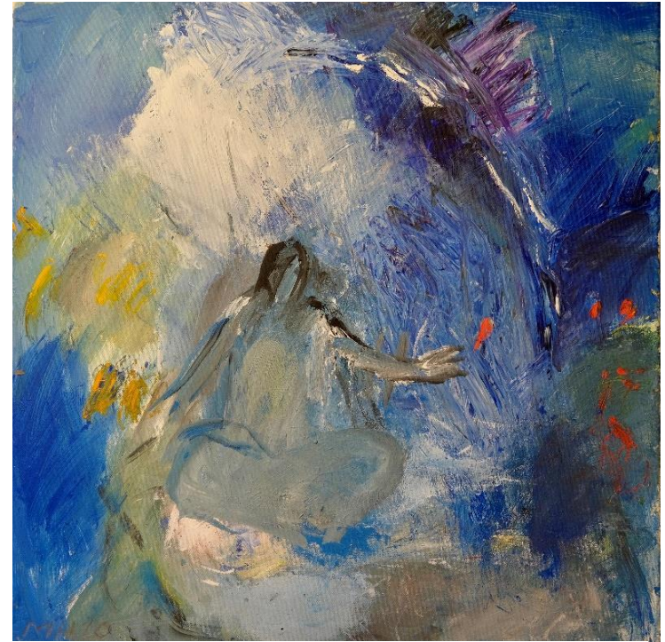
Maria Hafner, Der Traum , aus: «Talita Kum – Mädchen steh auf», Acryl auf Leinwand, 2010

(Veranstaltungen der Kirche St. Johannes siehe nächste Seite)